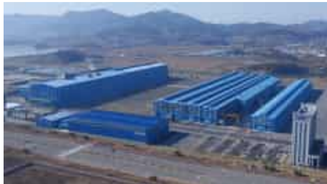
Pyeongtaek Hyundai Wia Tire Plant 평택 현대위아 타이어공장