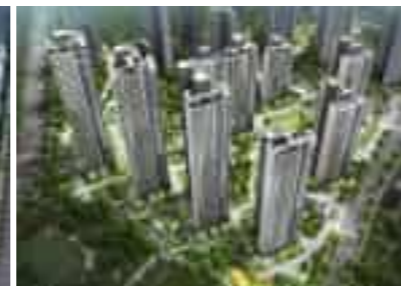
Hillstate Hakik 힐스테이트 학익