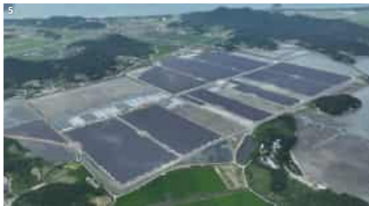
4. Goheung Bay Floating Solar Power Auxiliary Facilities and Power Generation Equipment 고흥만 수상태양광 부대설비 및 발전설비