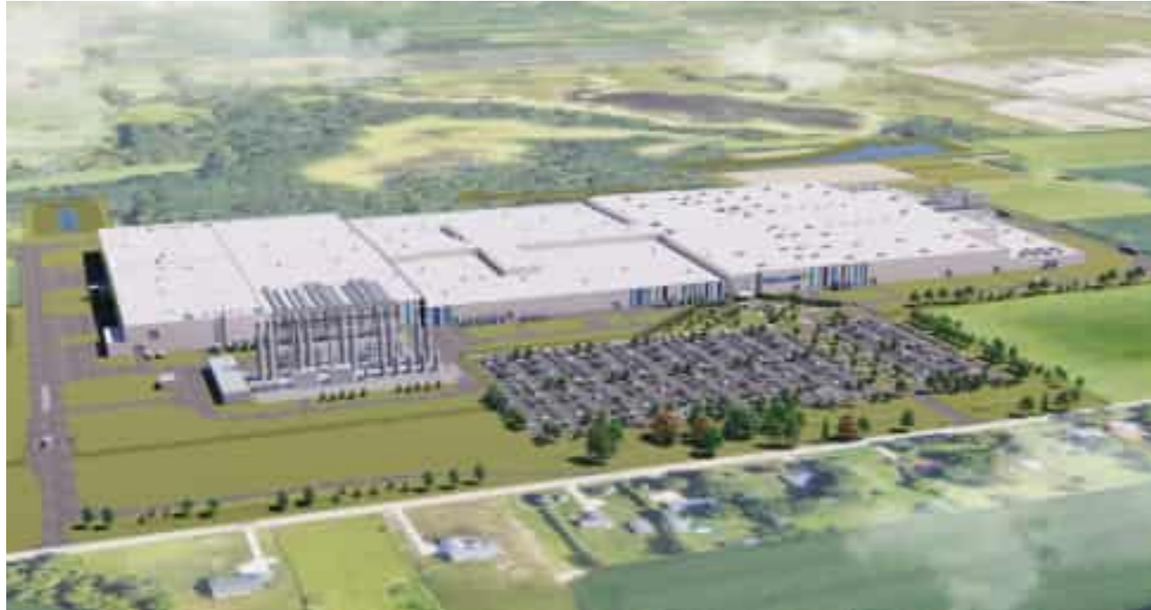
USA GM Ultium Cells 3 Data Center 미국 GM ULTIUM CELLS 3 DATA CENTER