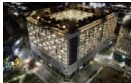
Namyangju Dasan Jigum Office Hotel 남양주 다산지금 오피스텔