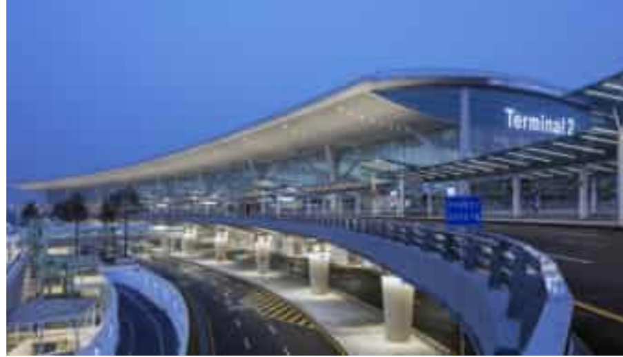
Incheon Airport Terminal 2 인천공항 제2여객터미널