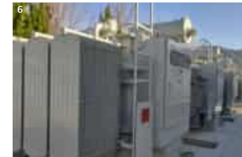
6, 7. ESS installation work KEPCO FR 3rd subordinate substation KEPCO FR 3차 ESS 설비 설치