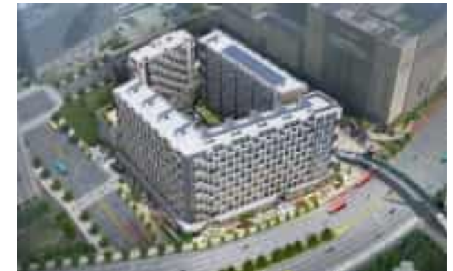
Pangyo AlphaDom Complex 판교 알파돔 복합시설