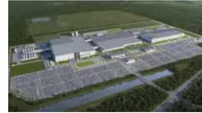
SK ON Electric Car Battery Plant in Kingston, USA 미국 킹스턴 SK ON ELECTRIC CAR BATTERY 공장