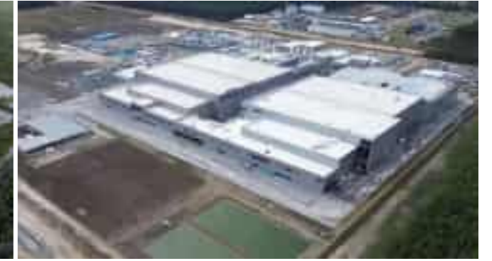
SK NEXILIS POLAND PLANT 폴란드 SK NEXILIS 동박공장