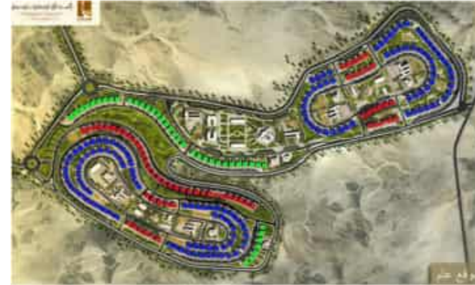
Libya Gubba Public Housing (2,000 units) 리비아 곱바 공공주택 (2,000세대)