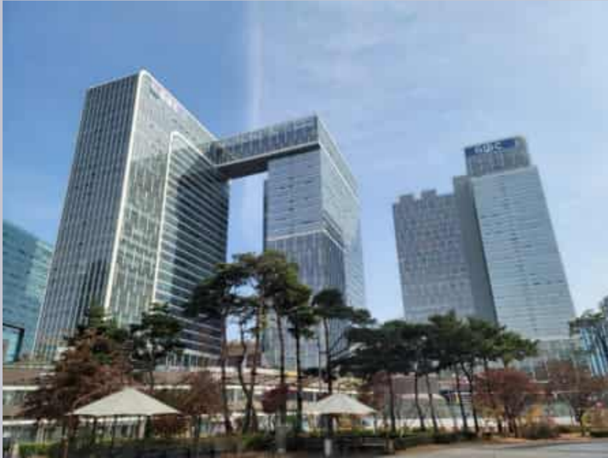
Gwangmyeong GIDC Knowledge Industry Center 광명 GIDC 지식산업센터