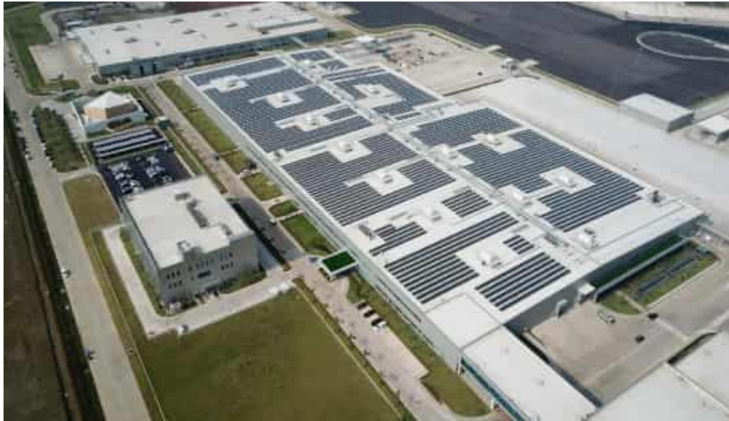
Bekasi Hyundai Motor Factory (HMMI) Construction I-Project Solar Power Installation - EPC, Indonesia 인도네시아 브카시 현대자동차 공장(HMMI)건설 I-Project 태양광 공사 - EPC