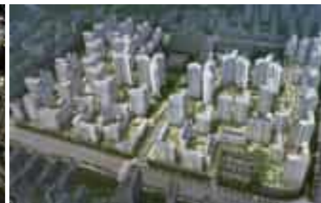
DH Firster I-Park 디에이치 퍼스티어 아이파크