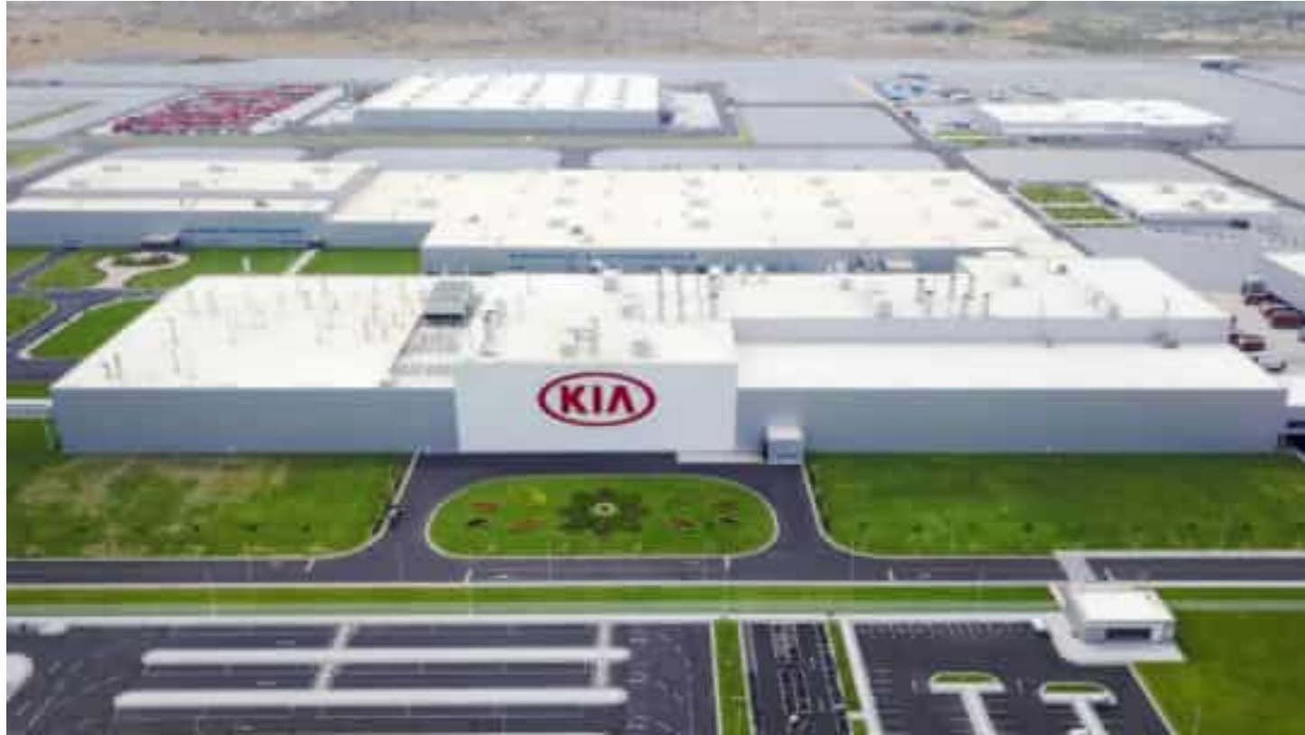
India Kia Motors Plant 인도 기아자동차 공장