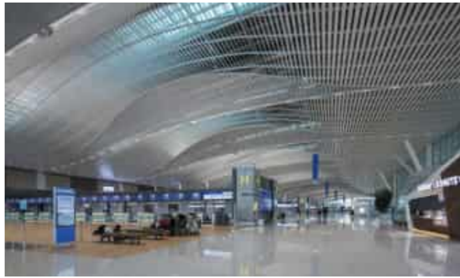
Incheon Airport Terminal 2 (Interior) 인천공항 제2여객터미널(내부)