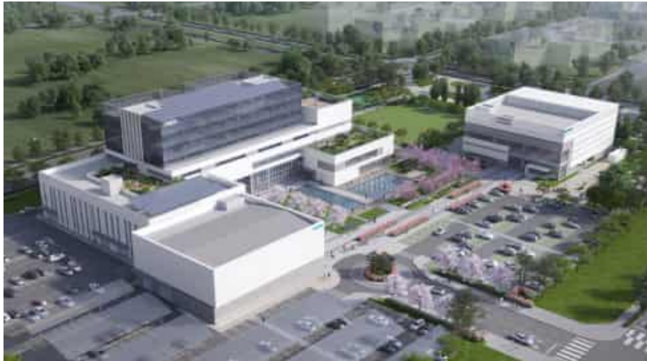
NHN Gwangju AI-Specialized Data Center NHN 광주 AI(인공지능) 센터