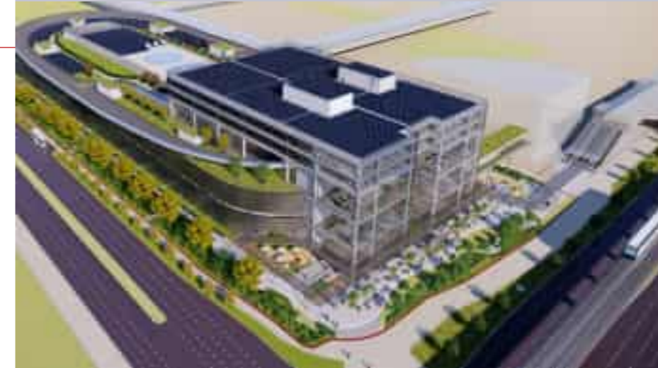
Hyundai Motor Global Innovation Center (HMGIC) Data System Construction 현대자동차 글로벌혁신센터(HMGIC) 데이터시스템 구축