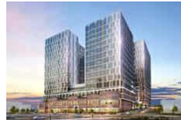
Suwon Woncheon-dong Knowledge Industry Center 수원 원천동 지식산업센터