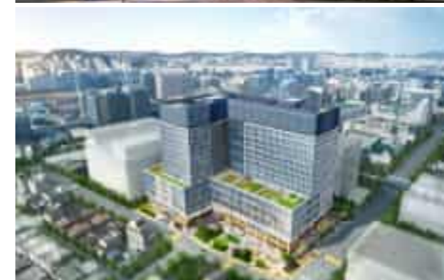
Gasan Terra Tower Knowledge Industry Center 가산테라타워 지식산업센터