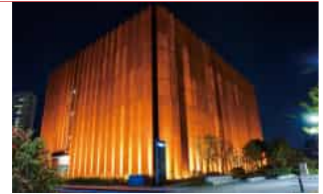
Sujee Genesis Exhibition Hall 수지 제네시스 전시관