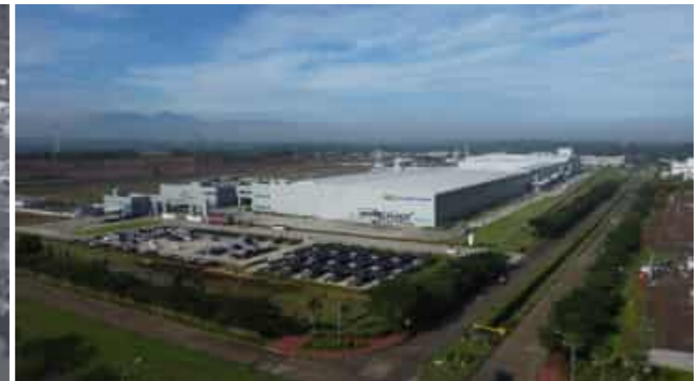
HLI Green Power Battery Cell Data Center, Indonesia 인도네시아 HLI Green Power Battery cell DATA CENTER