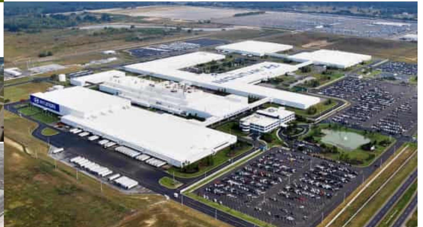
Hyundai Motor Plant in Alabama, USA 미국 앨라배마 현대자동차 공장