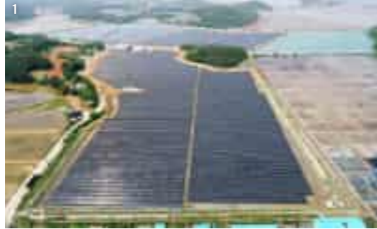
1. Taeam Samyang Solar Power Plant 태안 삼양 태양광 발전소